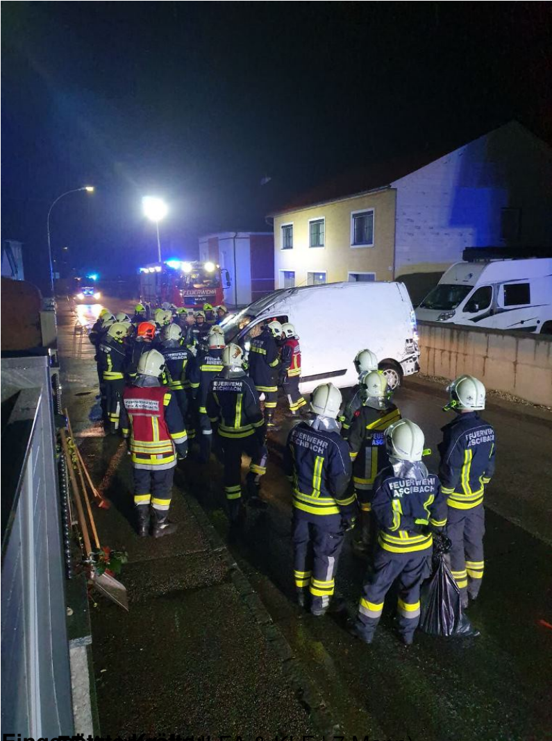
Eingestülpter in HLFA & KLF | 7 Mann) Hilfsleistung

Donnerstag, den 07. November 2019 um 05:47 Uhr